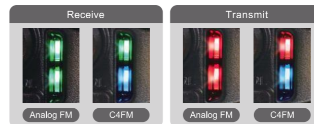
Indicador de modo

La función AMS (Selección automática de modo) reconoce automáticamente la señal recibida como C4FM digital o FM convencional, conmutando el receptor al modo adecuado. La función AMS permite el funcionamiento fluido acabando con la necesidad de conmutar de forma manual entre los modos de comunicación. Los indicadores de MODO muestran de un vistazo el modo de Transmisión/Recepción.