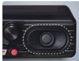
Altavoz frontal de 3 Vatios (35 x 58 mm)

El altavoz frontal proporciona un nivel de audio potente de 3 vatios. El sonido del altavoz del FTM-3200DE y FTM-3100E ha sido ajustado para incluso una mejor calidad de sonido. Un altavoz externo MLS-100 opcional soporta la operación en entornos de campo ruidosos.