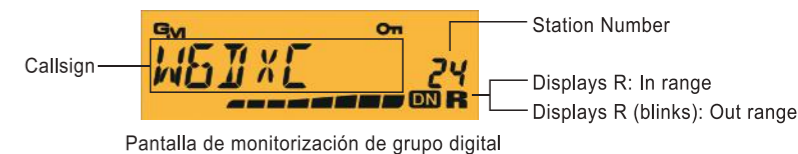
Pantalla de monitorización de grupo digital

Durante la comunicación en modo digital C4FM, la función digital GM advierte de forma automática al usuario si los miembros del grupo están dentro del rango de comunicación, y muestra en la pantalla la información de su ID o su indicativo de llamada.